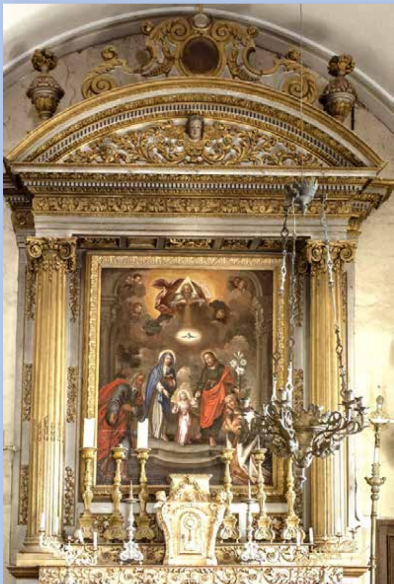
Le retable de l'église Saint-Roch de Montreuil-en-Auge (provient de l'abbaye du Val-Richer)