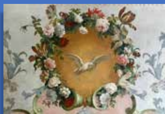
Église de Repentigny, détail de l'antependium, autel de la Vierge

Dominique Georges se soucie également de faire réparer l'ensemble des bâtiments religieux et les fermes de l'abbaye, de doter la bibliothèque de deux mille ouvrages et d'orner l'église abbatiale de tableaux et d'un mobilier nouveau. Ainsi se crée un intense foyer artistique dont le rayonnement s'étend aux églises rurales du Pays d'Auge. Leur mobilier des XVII e et XVIII e siècles est le plus souvent encore en place et en particulier, quantité de beaux retables, qui constituent une remarquable spécificité du patrimoine augeron.