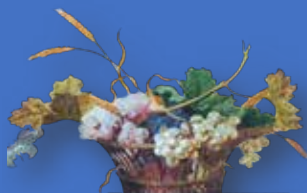
Détail de l'antependium du maître-autel, à l'église Saint-Roch de Montreuil-en-Auge

La nouvelle version du parcours Dominique Georges comportera douze églises que vous pourrez visiter, signalées dans la brochure par l'image ci-dessous. Nous terminerons ce parcours comme il se doit par la visite guidée du domaine actuel du Val-Richer (voir p. 40).