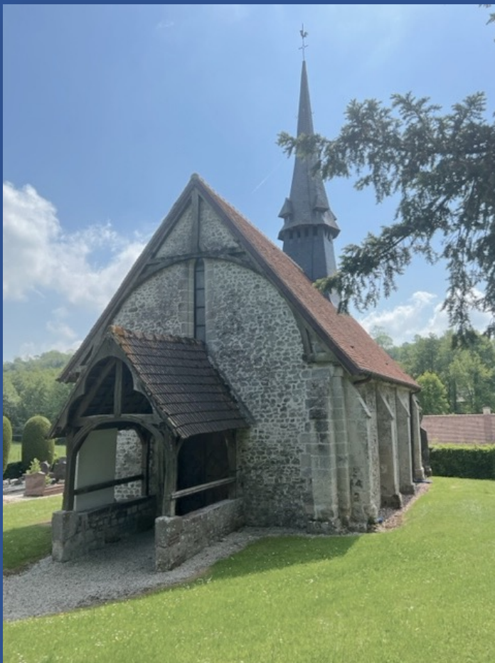
Notre-Dame de Druval