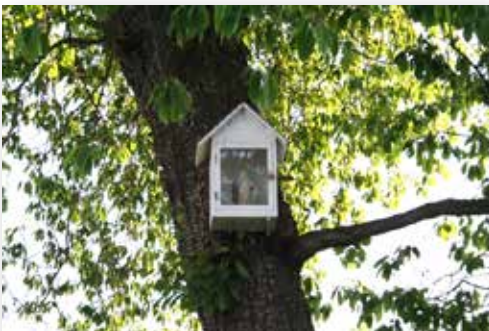
Statue de la Vierge, avant d'entrer dans le bois