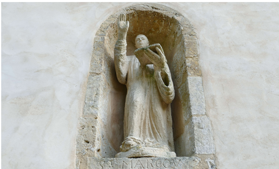
Saint Marcouf en Père-Abbé

Chapelle de Saint-Maclou ou de Saint-Marcouf , deux saints en un même lieu !