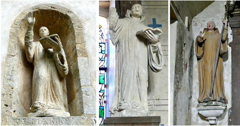
Saint Marcouf en Père-Abbé

Saint-Marcouf était d'origine franque, il est né à Bayeux en 490 et a été ordonné prêtre à l'âge de 30 ans.