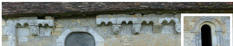
La corniche du mur Nord du chœur