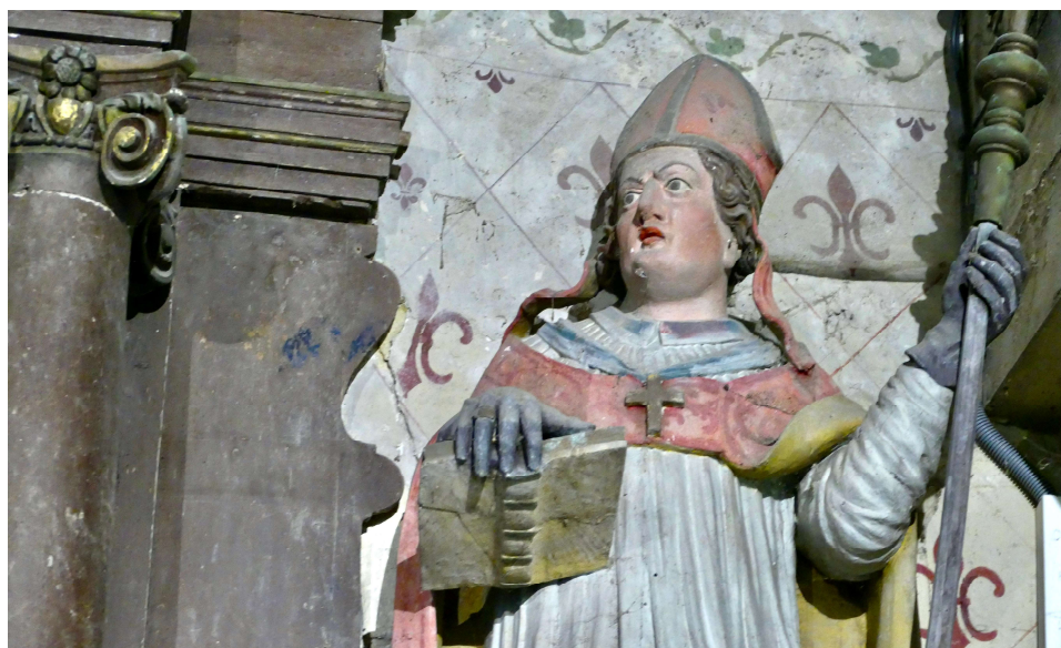
Saint-Maclou en évêque