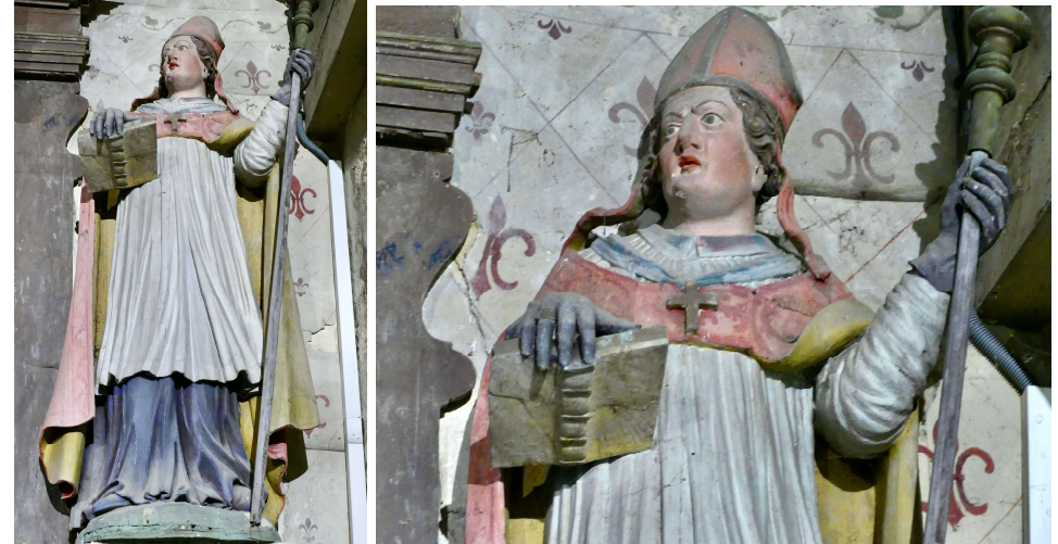
Saint-Maclou en évêque

Saint-Maclou est né en 547 au Pays de Galles.