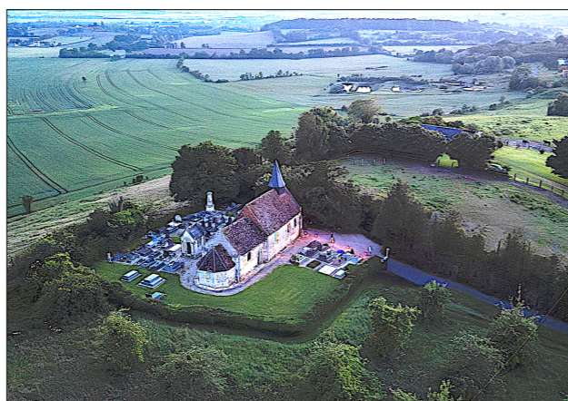
Mai 2024 - Département du Calvados

À la tombée de la nuit, le samedi 18 mai, parée de ses plus beaux attraits et de belles lumières, la chapelle de Saint-Maclou était bien au rendez-vous de Pierres en Lumières , le festival du patrimoine Normand.