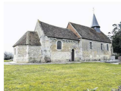
La chapelle de Saint-Maclou. H.J Lepetit.

À partir de 20 h 30, une veillée sera proposée jusqu'à 23 h 30. C'est dans le cadre de l'opération Pierres en Lumières, le festival du Patrimoine Normand, que les Amis de la Chapelle de Saint-Maclou proposeront une découverte de la chapelle à la tombée de la nuit. Les murs ancestraux transporteront les visiteurs à l'époque médiévale. « Au programme, illuminations, flambeaux et visite