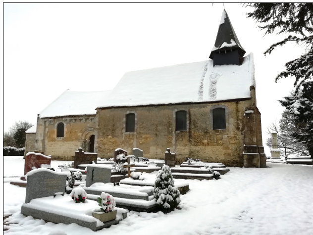
Chapelle de Saint-Maclou - Janvier 2024